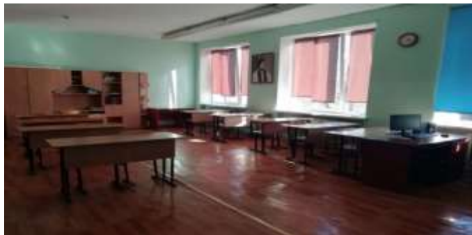
Фото после ремонта: